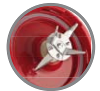
Chiusura ermetica con guarnizione