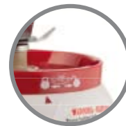
Indicatore blocco/sblocco lame