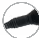
Cavo elettrico da 2,5 mt con snodo a 360°