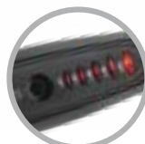
Tasto on/off e indicatori temperatura

Alette brevettate sul dorso della spazzola per favorire smaltimento calore ed evitare scottature