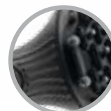
Impugnatura ergonomica con protezione