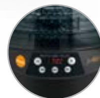
Display digitale con timer e selettore temperatura