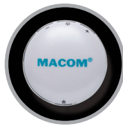
Unità di controllo