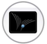
Base d'appoggio protettiva