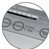
Due programmi normale/delicato