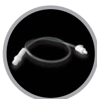
Tubicino sottovuoto barattoli