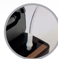
Attacco adattatore tubicino