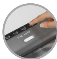
Pannello comandi soft touch