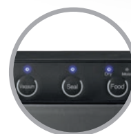
Comandi con luci LED