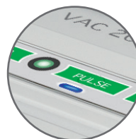
Pannello con comandi soft-touch