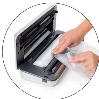
Taglierina di Precisione Per sacchetti su misura senza sprechi