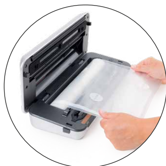
Portatagliarotolo In soli 16 cm di profondità