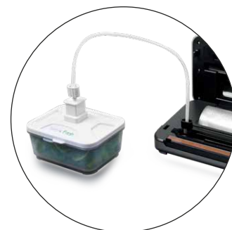
Adattatore con tubicino per sottovuoto contenitori